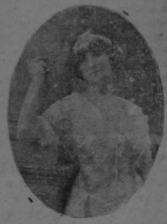
Matilde Azquerino Primera dama joven