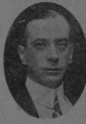
Mariano Diaz de Mendoza Primer actor

llegará a esta capital el 7 del corriente